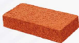
Ladrillo Sólido 4"