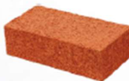
Ladrillo Sólido 6"